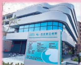
西宮渡辺病院 新棟（西館）完成

職員は生命の尊重と人間愛とを基本とし、常に奉仕の精神を忘れず、医療の質の確保と向上に努めます。