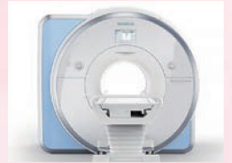
MRI : MAGNRTOM Skyra 3T 導入