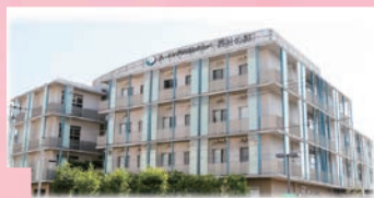
平成30年6月 西宮渡辺脳卒中・心臓リハビリテーション病院 開院

平成 28 年 8 月 日本医療機能評価機構 3rdG：Ver1.1 認定（西宮渡辺病院）