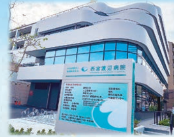
令和5年10月 新棟(西館)完成