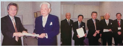
平成22年4月 兵庫県健康福祉部健康局にて社会医療法人の認定証授与(兵庫県初認可)

職員は生命の尊重と人間愛とを基本とし、常に奉仕の精神を忘れず、医療の質の確保と向上に努めます。