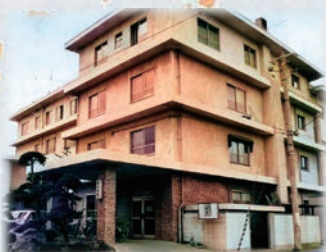
昭和40年11月 渡辺病院開設