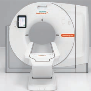
CT：64列X線CT SOMATOM go.top (令和元年 導入)