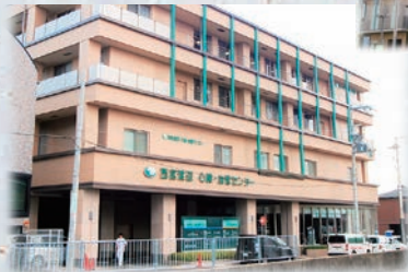
西宮渡辺心臓・血管センター 開設