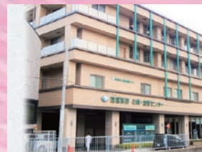
西宮渡辺心臓・血管センター 開院