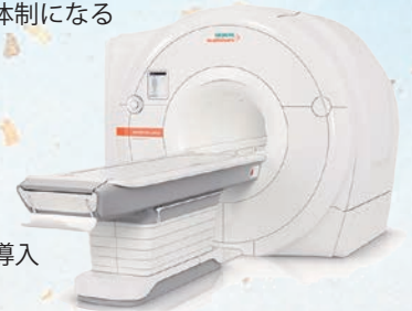
MRI：3テスラ Magnetom Lumina

●令和5年10月 新棟完成し、新たに耳鼻咽喉科・眼科・ 歯科口腔外科の外来診療が開始