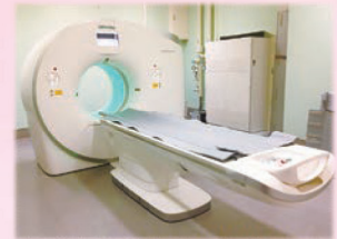
CT : 新型デュアルソースCT SOMATOM Force