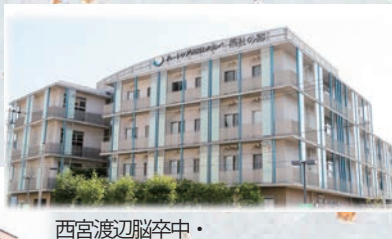
西宮渡辺脳卒中・心臓リハビリテーション病院 開院