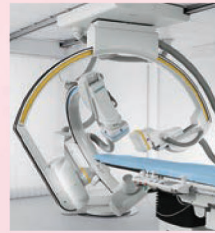
Artis zee BC PURE 導入