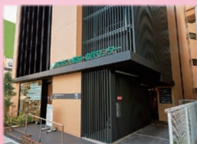
令和2年6月 新棟「健康館」完成