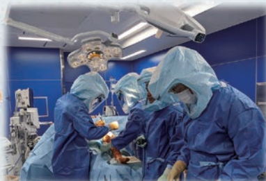
人工関節センター手術風景