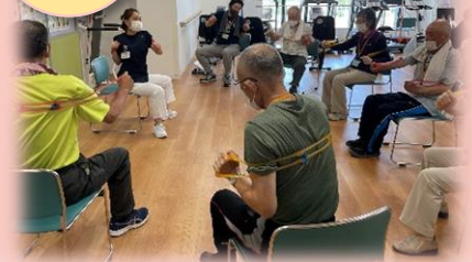
レジスタンス運動