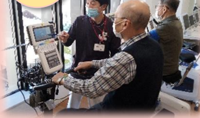
自転車エルゴメーター